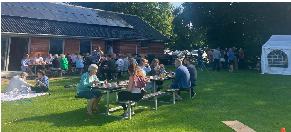
Billedet er fra sidste års Sensommerfest.